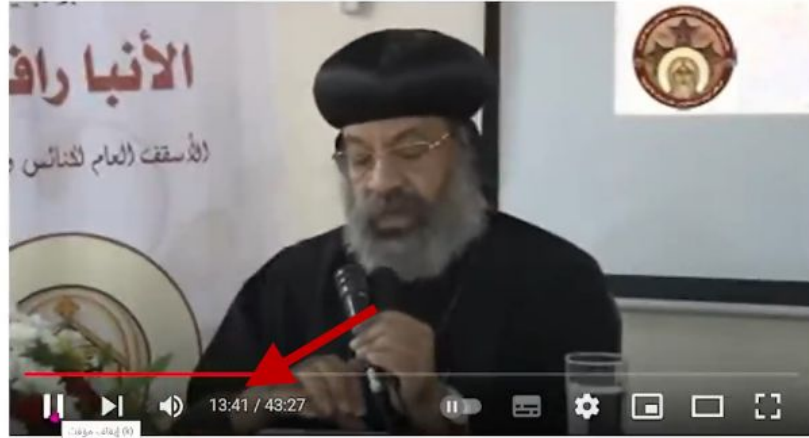
محاضرة عن الثالوث - نيافة الأنبا رافائيل

عرض جزء من الدقيقة إثنين ثم علق ثم قفز مباشرة الى الدقيقة 13 من محاضرة الأنبا رافائيل مش ده كذب وغش يا ميمو؟ أحكم إنت على نفسك وتوب قبل ما يتحكم عليك