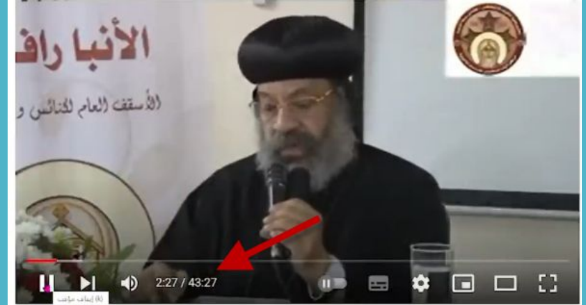
محاضرة عن الثالوث - نيافة الأنبا رافائيل